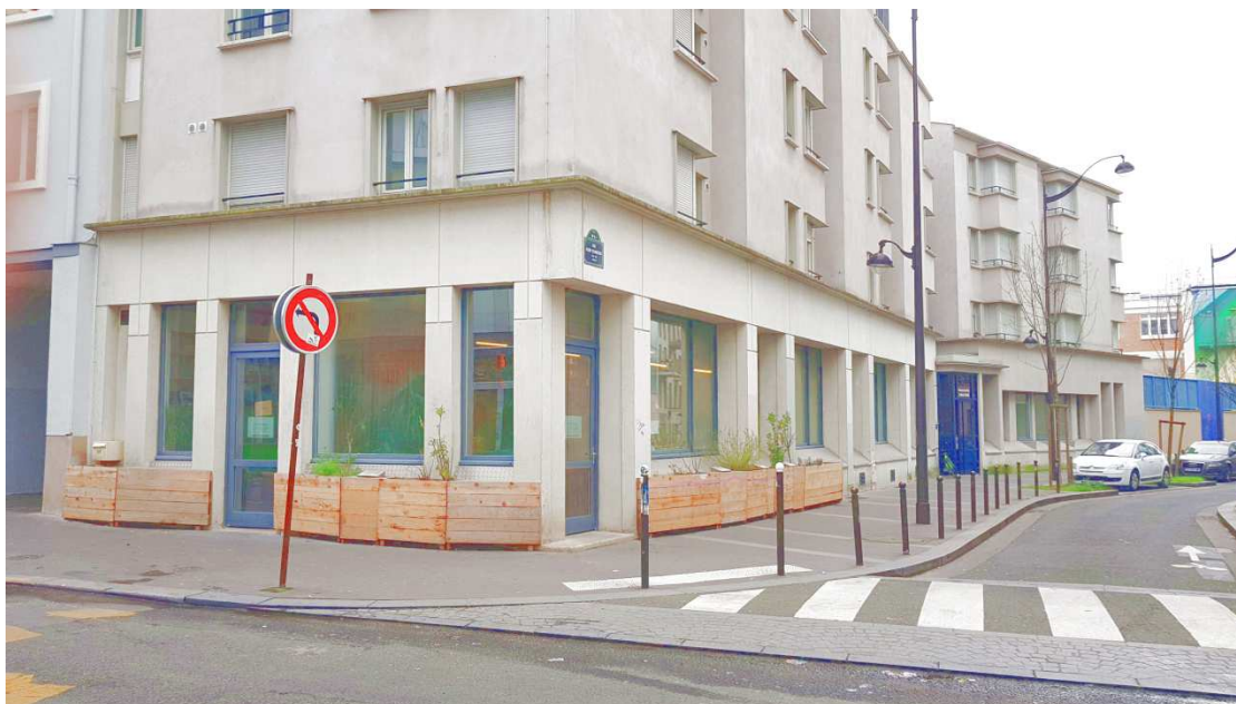
L'entrée principale de la résidence Andrée Chedid est la porte bleue au milieu du bâtiment. Notre local possède les deux fenêtres hautes, au fond à droite, au-dessus de la voiture blanche.

Il y a souvent des colis de livres à livrer ; à ce moment-là nous covoiturerons et stationnerons la voiture à proximité.