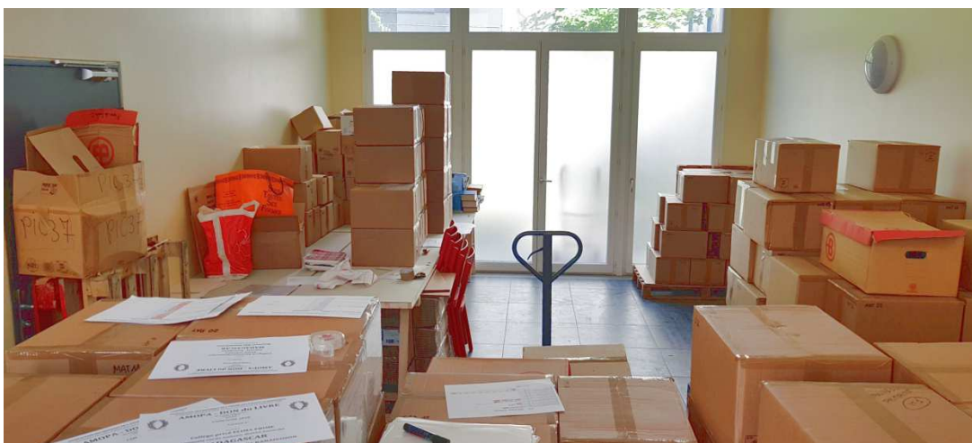
Et ce même lieu, après le rangement du stock de saint Germain-en-Laye

Le nouveau local est chauffé, largement éclairé, il bénéficie, contrairement à celui de Jeanne d'Albret d'une connexion Internet qui permettra de travailler directement avec les sources BNF et SUDOC, enfin, il est pourvu de sanitaires entretenus.