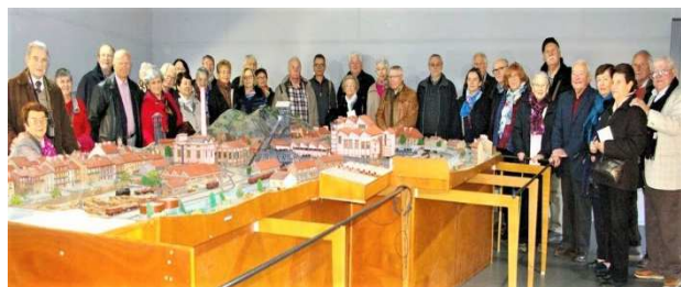
Au musée, le groupe devant la maquette dédiée à la période charbonnière de Cransac.

Franc succès pour notre sortie à Cransac : 32 amopaliens et 4 invités ont pu visiter le musée, les thermes et « la Triangulaire » (œuvre d'art contemporain et de mémoire). Le repas fut servi à l'Hôtel du Parc, ancienne résidence des ingénieurs de la mine. Le groupe s'est également arrêté devant le buste de Jean Jaurès et le monument aux morts de type pacifiste.