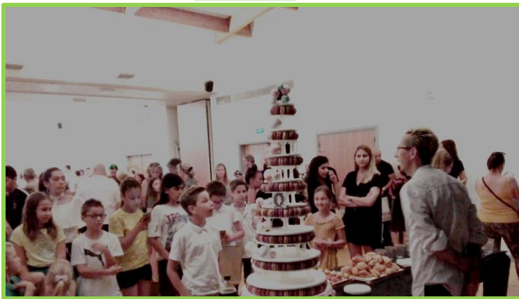
La pyramide de macarons