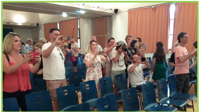
On veut garder un souvenir de cette cérémonie