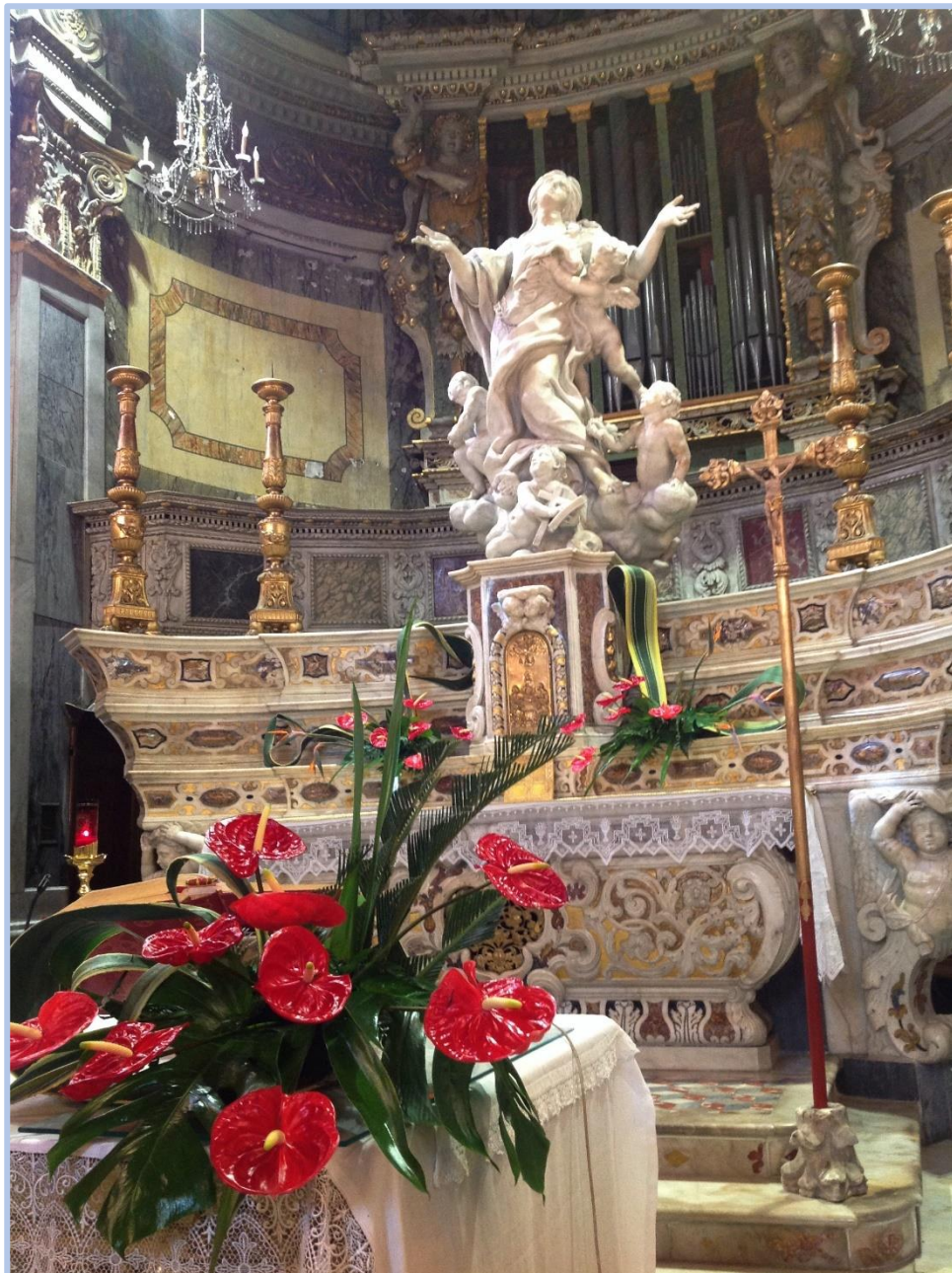
Église de Bordighéra - Le cœur