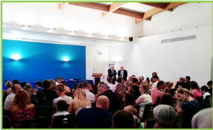
Allocution de M. le Directeur académique