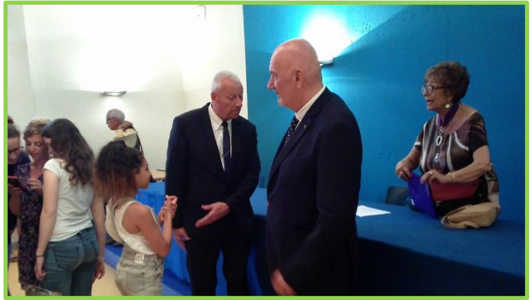
M. le Directeur académique s'entretient avec une jeune lauréate