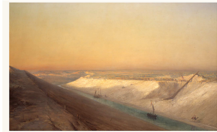
F.P. Barry : « Le chantier du canal en 1863 »

Exposition « L'épopée du canal de Suez » le 08/06 à 15h