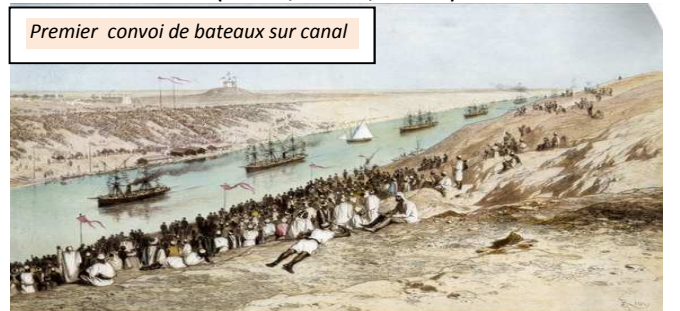
Premier convoi de bateaux sur canal

Au fil des salles nous découvrons d'abord que cette idée de creuser un canal remonte à 4000 ans et que plusieurs projets de liaison entre les deux mers avaient été envisagés avant celui de Ferdinand de Lesseps, puisque la vie du canal, compte tenu de sa situation géopolitique, fut rythmée par de nombreux conflits (1956, 1967, 1973)