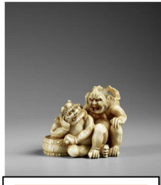
Netsuke en ivoire

Les Netsukes exposés sont des petites sculptures japonaises réalisées en ivoire, bois, céramiques ou écaille, sculptées sur toutes les faces et percées de deux trous pour laisser passer la cordelette. Ces objets d'art qui se généralisent à partir du XVII ème siècle, sont parfois drôles, effrayants ou touchants. Parmi les 7000 objets conservés au musée il convient de remarquer un ensemble de coffres en bois laqué, de style Namban, des porcelaines à décor émaillé, de style Kakiemon, et des céramiques de Kyoto ainsi que des masques d'animaux et de chimères.