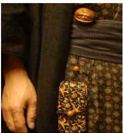
Sagemono et netsuke

La collection est composée de très nombreuses statuette Netsukes, objets vestimentaires japonais servant à maintenir le Sagemono, terme générique qui désigne les petits accessoires que les Japonais inséraient dans le Obi (ceinture servant à fermer les vêtements traditionnels japonais) de leur Kimono, car ces derniers n'avaient pas de poches pour déposer leurs petits effets personnels. En effet, la solution était de placer ces objets dans des boites suspendues par des cordes à l'Obi.