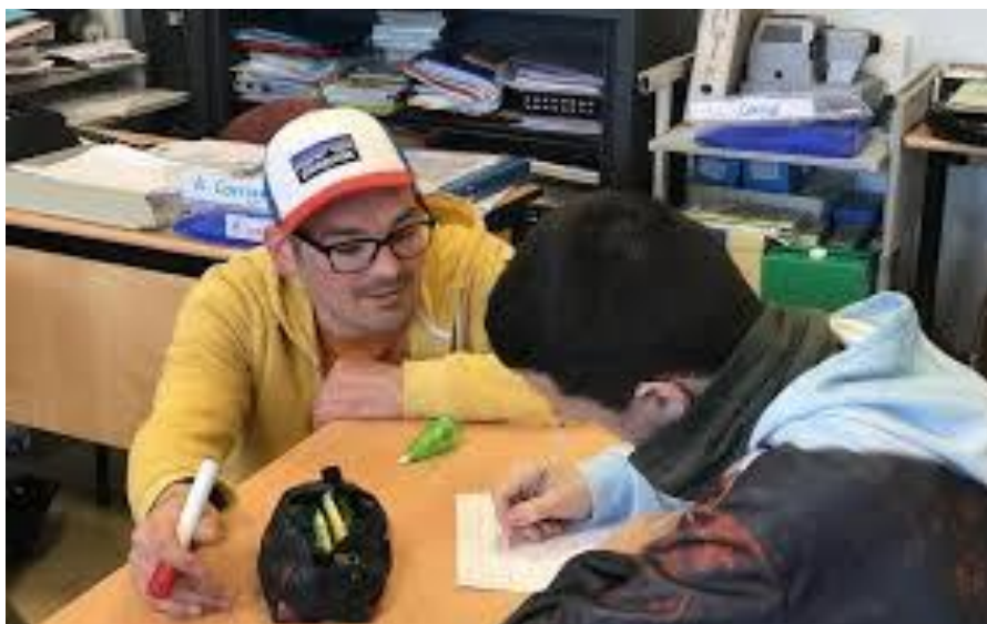
Des collégiens s'expriment par le slam.

Les différentes étapes : inciter ces élèves à écrire et déclamer en milieu scolaire, avec leur professeur de français ; organiser une confrontation amicale, suivie d'un vote permettant de dégager les meilleures productions, dotées de prix.