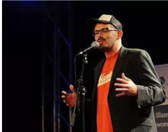
PoiSon d'AVRIL.

Ce projet a révélé une véritable adéquation de cette forme d'écriture avec les collégiens et le grand intérêt porté par les enseignants. La presse locale fut conviée à la première séance et n'a pu que constater leur intérêt.