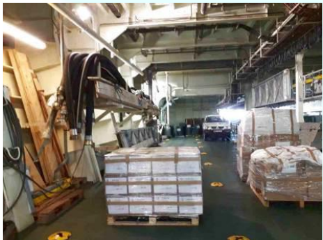
dans une frégate de la Marine