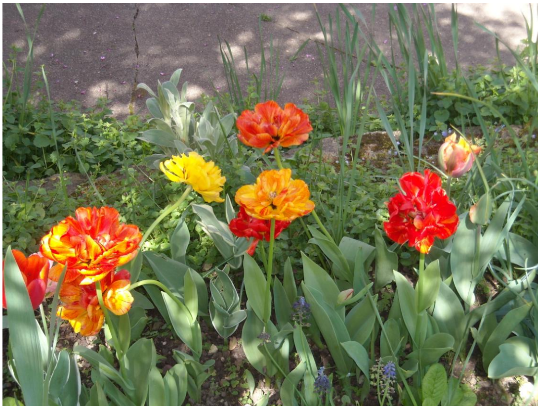
Le Printemps 2021