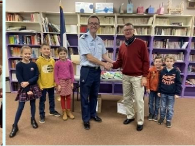
Don à Charleston (USA)