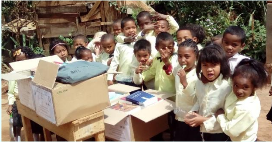
Don à Madagascar