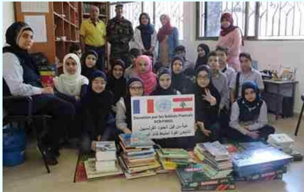
Don au Liban