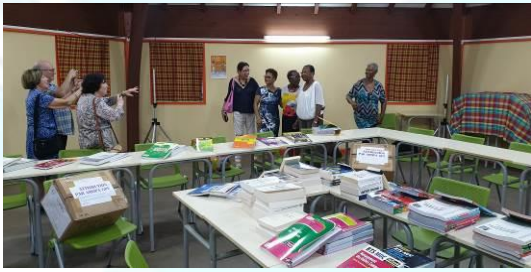
Don à La Guadeloupe