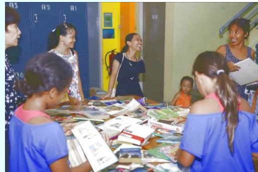
Don à Bali