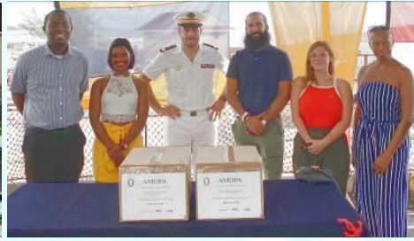
Don à La Barbade (Caraïbes)