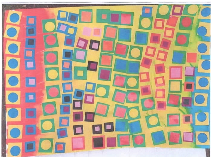
Maternelle Paul Eluard VALENTON

Elles ont obtenu un prix départemental et un premier prix national pour la classe de sixième du collège du Fort à Sucy en Brie.