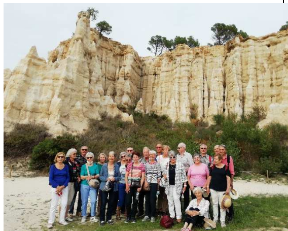
Devant les orgues d'Ille-sur-Têt

Notre voyage en Roussillon a permis aux membres de notre section inscrits pour ce séjour de découvrir cette belle région. Un carnet de voyage rédigé et illustré par les participants sera prochainement adressé à tous nos adhérents. Rappelons que nous accueillons dans nos voyages et dans la limite des places restantes nos amis de l'ANMONM et de la SMLH (Associations de membres de l'Ordre National du Mérite et de la Légion d'Honneur) et que nos séjours comprennent toujours un volet culturel (soit, pour ce séjour, la visite commentée du musée Hyacinthe Rigaud à Perpignan).