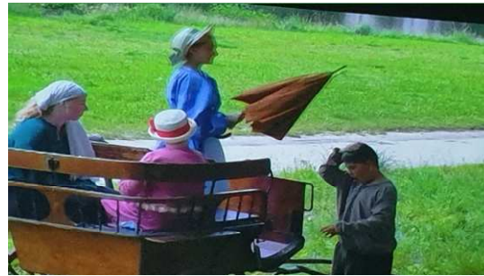
Scène du film