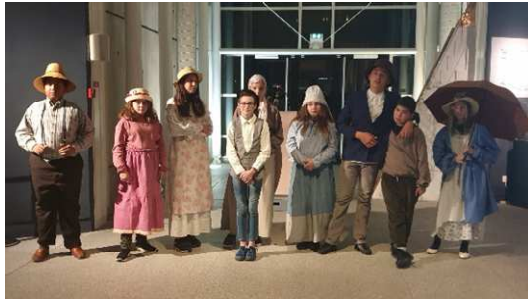
Les jeunes artistes en habits d'époque