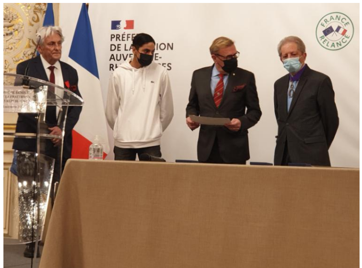
Remise du prix d'honneur, par le jury, au jeune sapeur-pompier volontaire