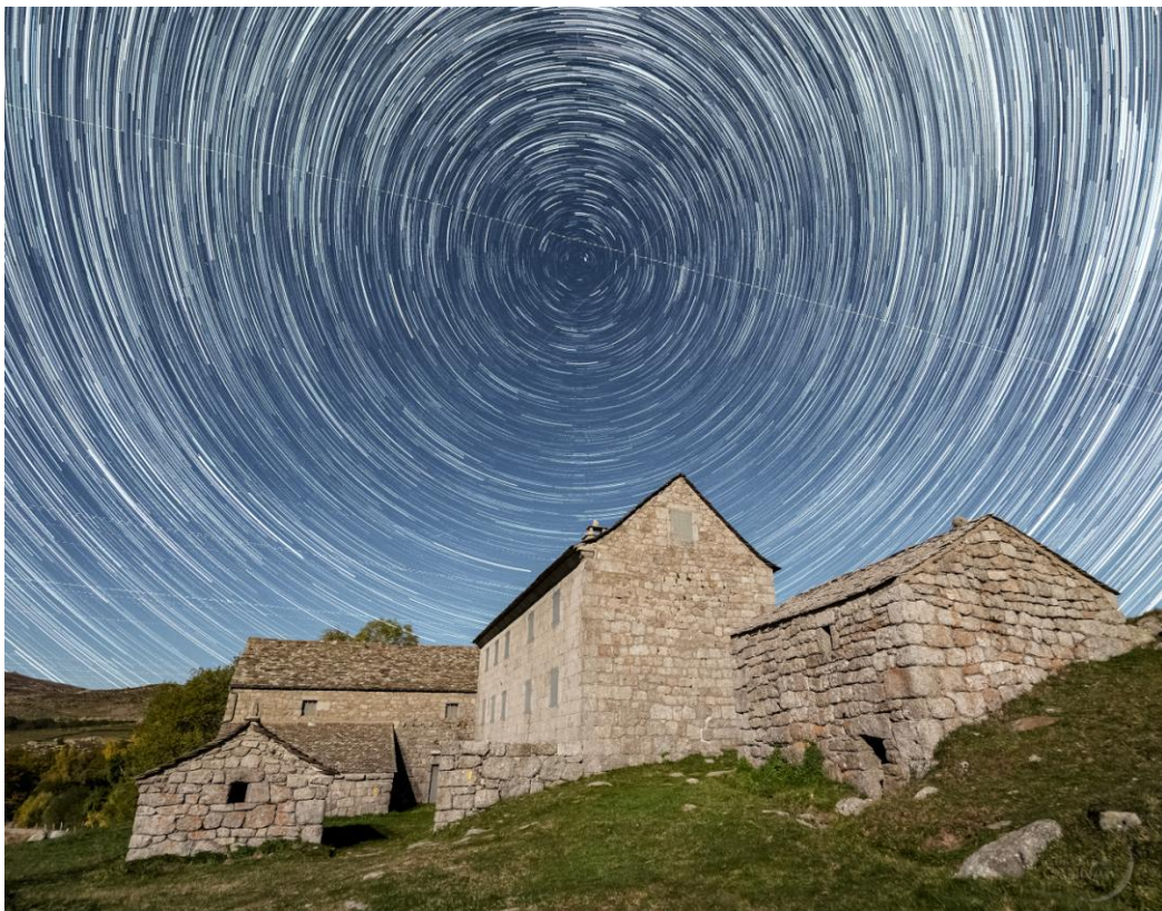
Photo : Guillaume Cannat : Une nuit sur le Mont Lozère : « Le Mas Camargues somnole sous la ronde des étoiles » Extrait du Site : www.leguidedu ciel.net