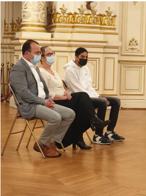
Les trois lauréats primés