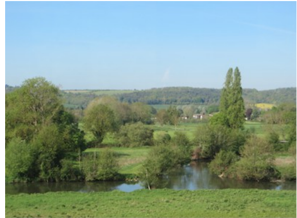
Nous apprenons que l'absence de pesticides permet le retour des bleuets et coquelicots à la belle saison