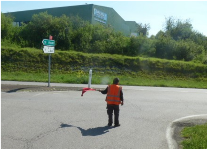
Image insolite : celle de membres de l'association CFVE qui arrêtent la circulation aux passages à niveau non pourvus de barrières. Il y a 16 passages à niveau au total pour cette ligne 16,5km.