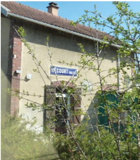
et la halte de Hécourt : c'était un arrêt facultatif autrefois