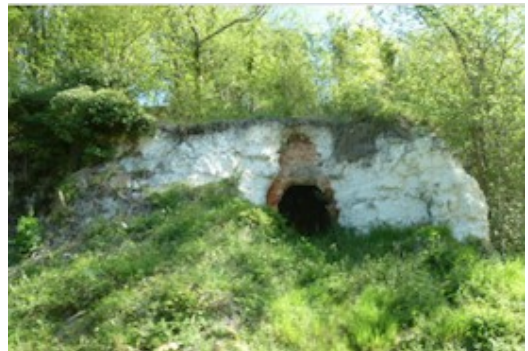
Au passage nous apercevons un ancien four à chaux