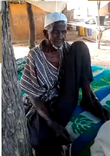
Le chef du village