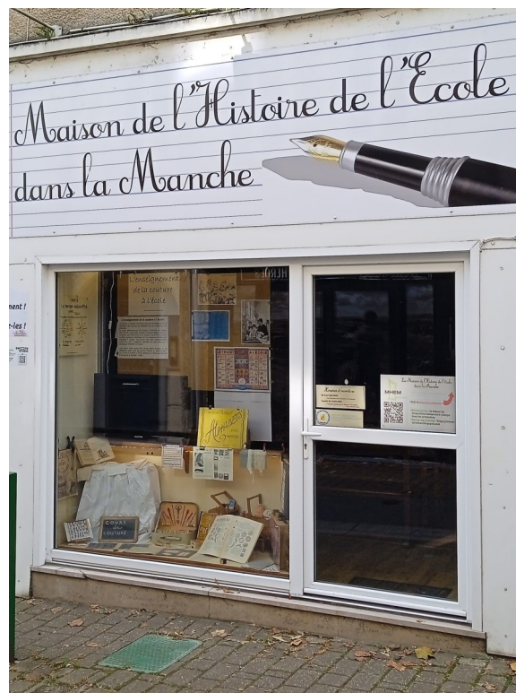
Vitrine octobre 2023 « Couture à l'école »