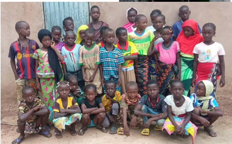
Photo des élèves qui a accompagné la lettre de remerciement

Association Tapama LBP 213 50302 Avranches Cedex Tél: 06 41 85 71 09 tapama@orange.fr https://www.tapama.org