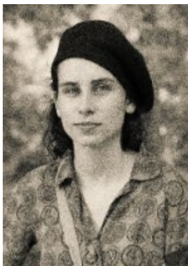
Résistante française 1944 (23 ans)

* le programme pour le mois de mai sera diffusé ultérieurement