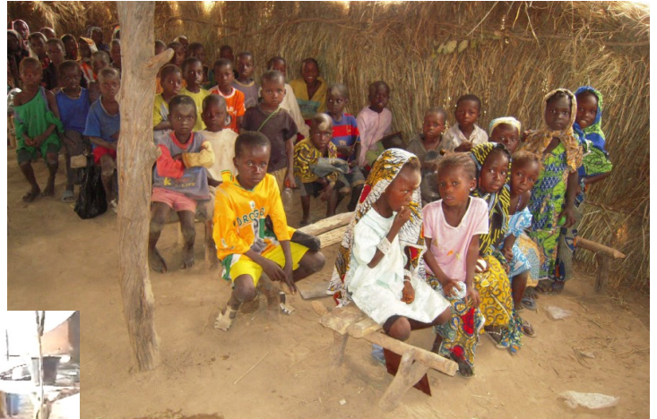
Les élèves de Mansonkolon lors des cours à l'école du village