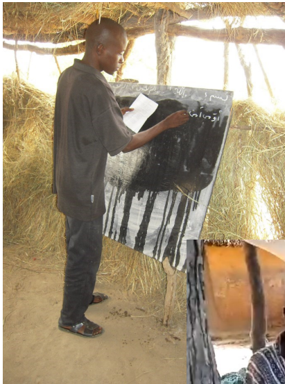
L'enseignant et son tableau...