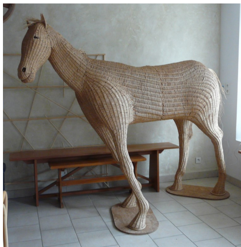
Cheval en osier réalisé dans l'atelier