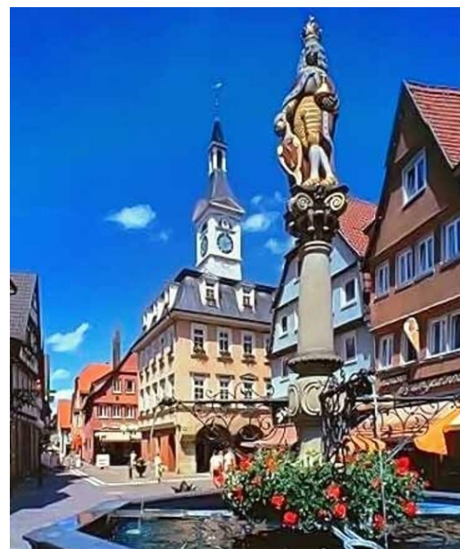
Place du marché à Aalen