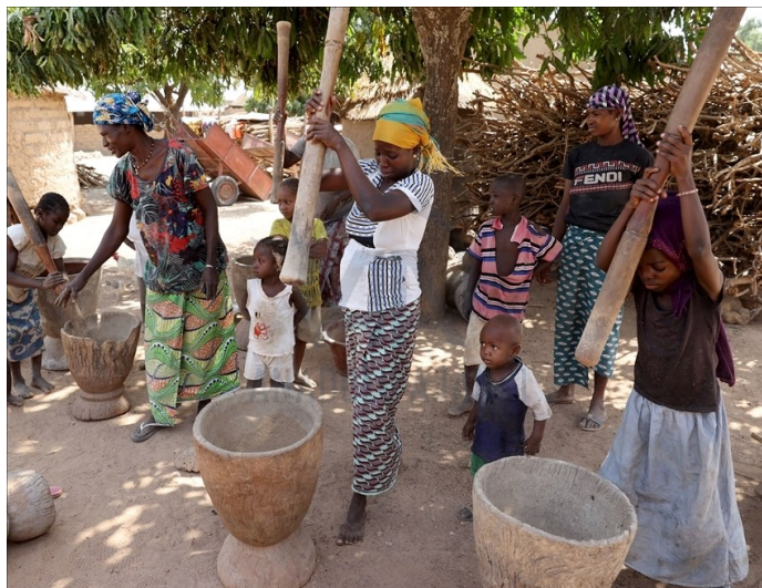
Enfants et femmes au Mali