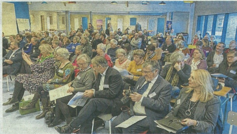
→ Une assistance nombreuse a participé à ces Rencontres autour du thème « Les Irlandais et la Manche : liens culturels et historiques », dans les locaux ouverts pour la circonstance par les sœurs de la congrégation de Sainte-Marie-Madeleine-Postel, à Saint-Sauveur-le-Vicomte.