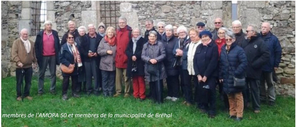
Participants: membres de l'AMOPA 50 et membres de la municipalité de Bréhal

Jusqu'au début du XVII e siècle, l'histoire du château et du port de Regnéville sont intimement liés. Même si l'importance du port fut parfois exagérée, il reste néanmoins une place commerciale très importante dans le Cotentin, un lieu d'échanges particulièrement florissant aux XIII e et XIV e siècles. Depuis la seconde moitié du XI e siècle, les seigneuries de Regnéville et de Montchaton appartenaient aux seigneurs de la Haye (du-Puits), apparentés aux grandes familles féodales de l'époque, Néel, Néhou, Reviers et Tesson.