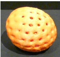
Grain de pollen de marguerite