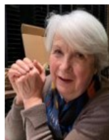
Langlois M-France Activités culturelles nord