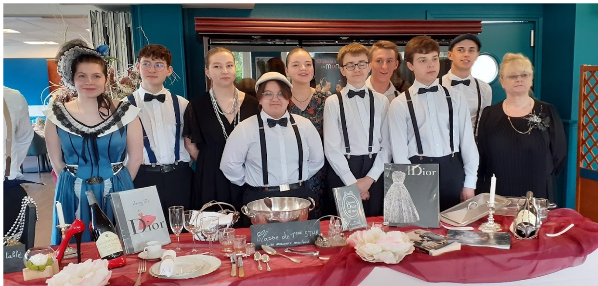
Les élèves du lycée costumés « années 1950 » pour le service en salle