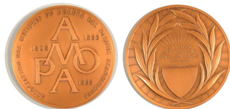
Médaille de l'AMOPA

À l'avers est gravée la formule empruntée au philosophe grec HERACLITE : "le soleil est nouveau tous les jours"