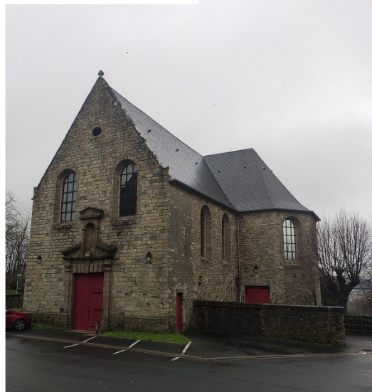
La chapelle désaffectée