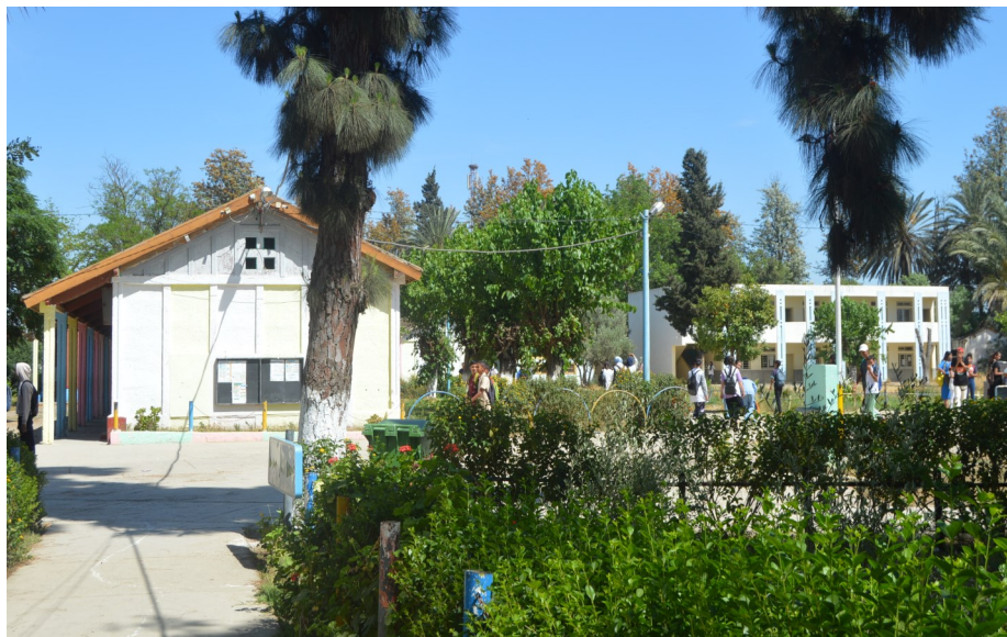
Le collège-lycée Ibn Baçal de Mechraa-Bel-Ksiri

André et Monique LETOURNEUR 9, rue Louis Beuve 50290 BREHAL andre.letourneur@wanadoo.fr 09 71 36 11 05 ( fixe ) 06 15 78 57 28 ( portable )