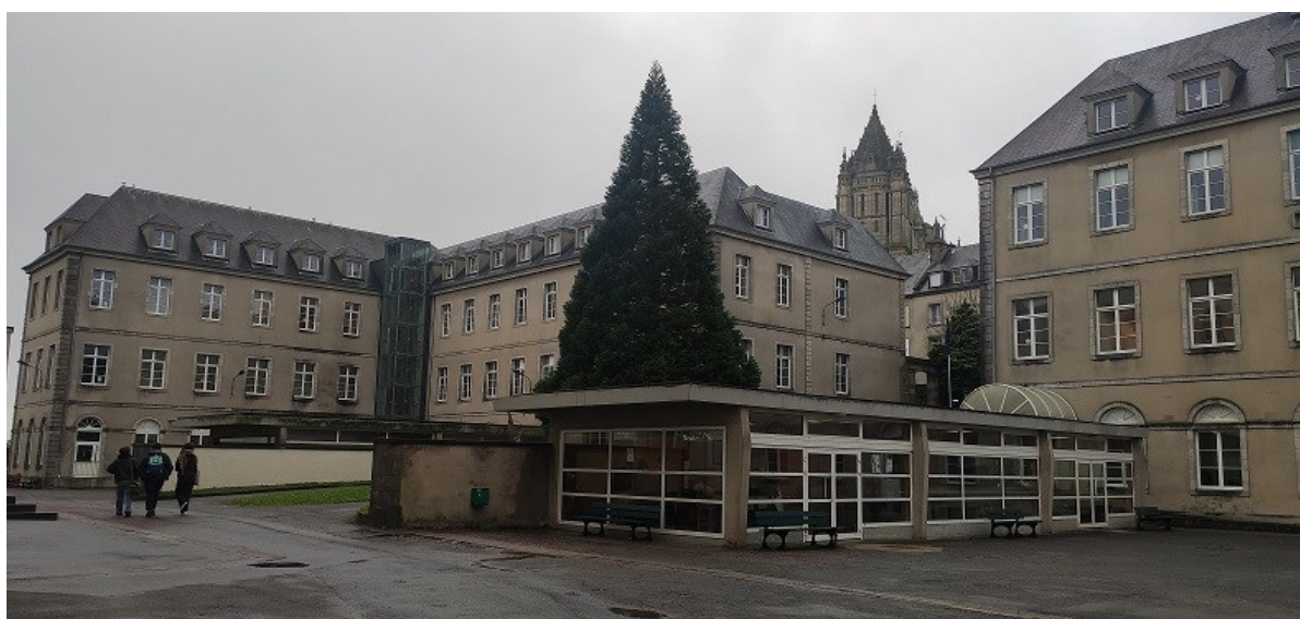
Cours du lycée Le Brun