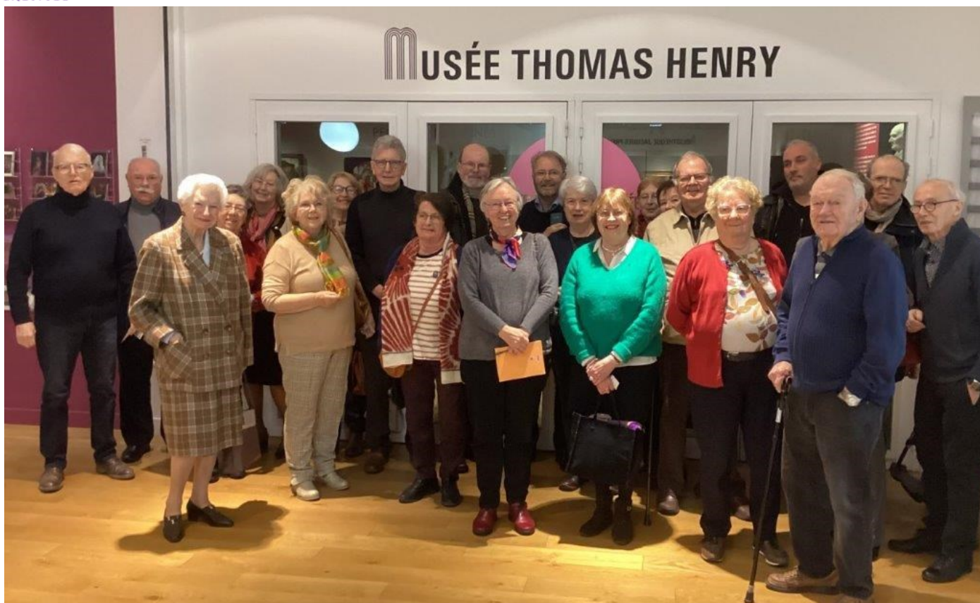
Participants: membres de l'AMOPA 50

Vie de l'association: visite de l'exposition « Archéo Cotentin, la conquête d'une presqu'île – 300 000 à 30 avant notre ère »