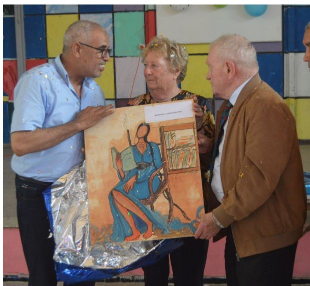
À gauche: Le 1er vice-président du Conseil municipal offre un tableau au nom de la municipalité